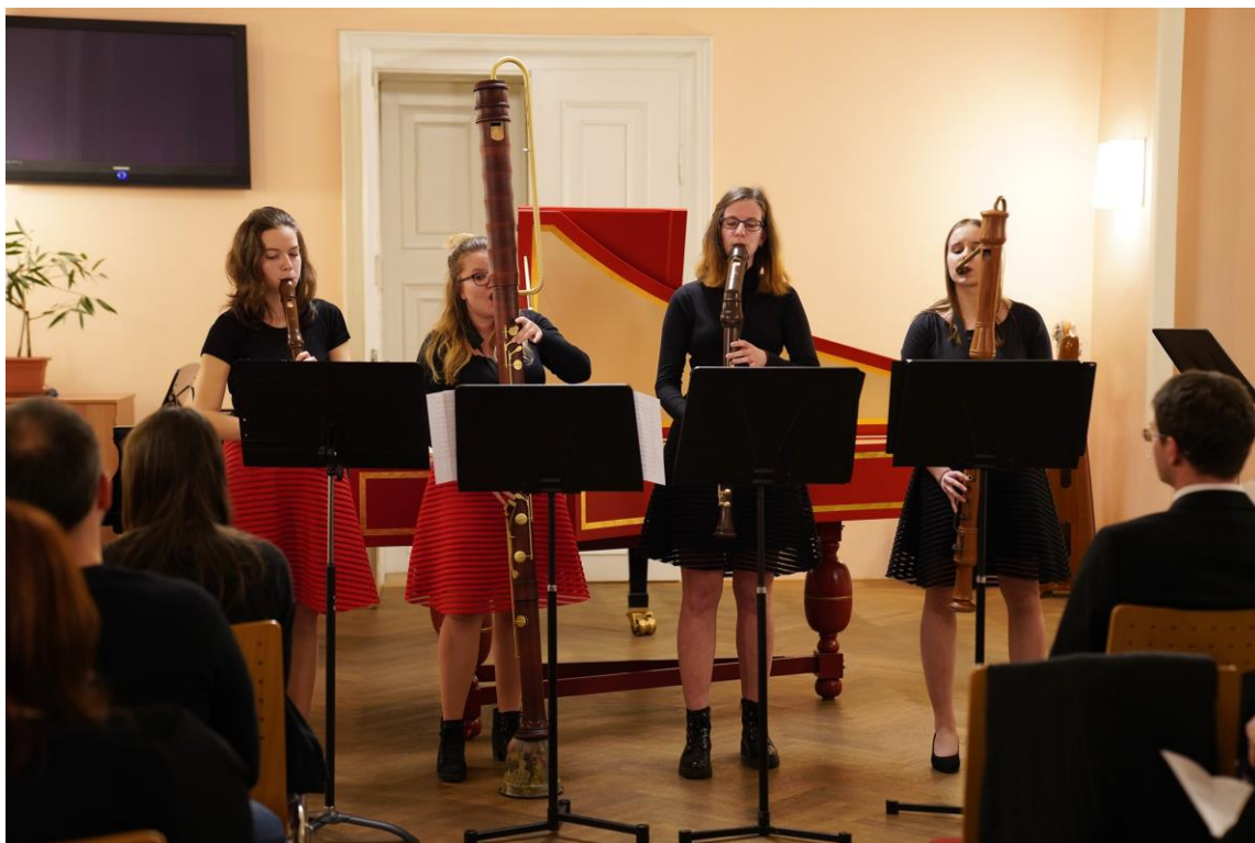
Kvarteto zobcových fléten

26. 2. 2020 – Abonmá Kea „Společně..." – 2. koncert